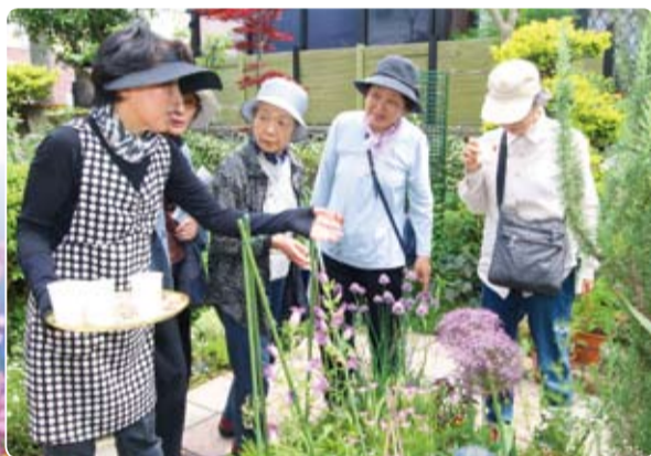
▲花の育て方や庭づくりについて、熱心に聞く来場者