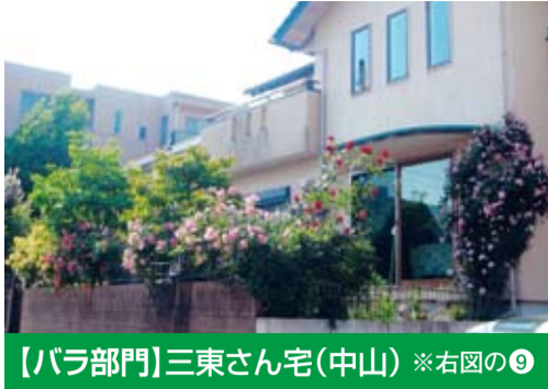
【バラ部門】三東さん宅(中山) ※右図の9