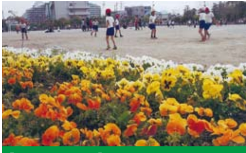
【学校花壇部門】 富美浜小学校 花ボランティア ※右図の18