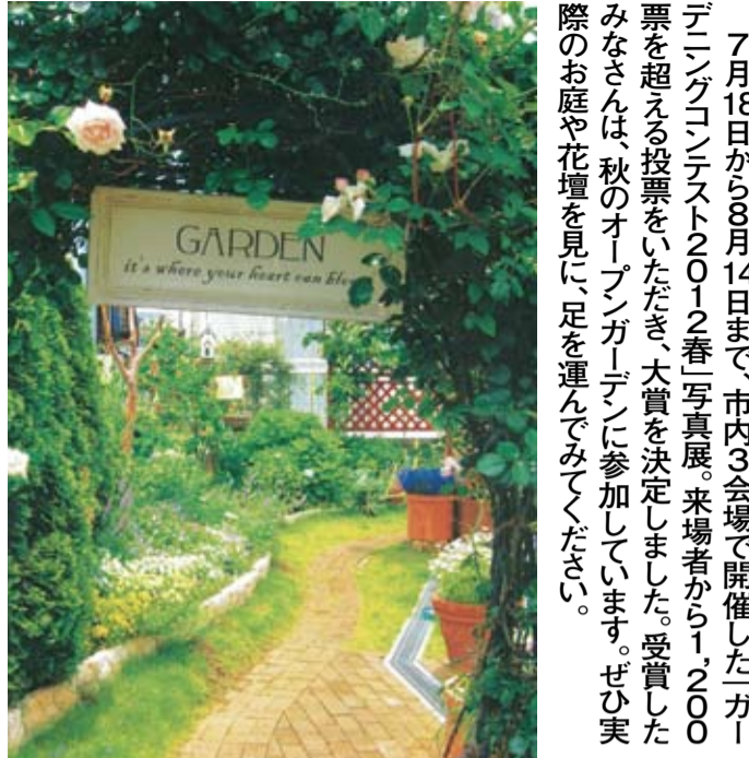
【ガーデン部門(上)】【ミニガーデン部門(下)】 小川さん宅(真間) ※2部門同時受賞 ※右図の1