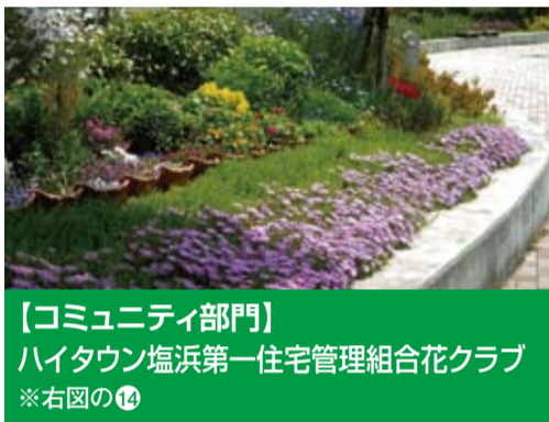
【コミュニティ部門】 ハイタウン塩浜第一住宅管理組合花クラブ ※右図の14