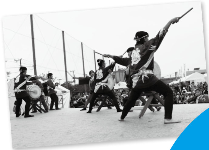
▲観客が見守るなか、ステージでは和太鼓の演奏など(上)が行われる ▶大勢の来場者でにぎわう会場(右)

広報いちかわは新聞折り込みでお届けするほか、市内各駅の広報スタンドと公共施設で配布しています。入手困難な方で自宅への配布をご希望の場合は、広報広聴課へお問い合わせください。