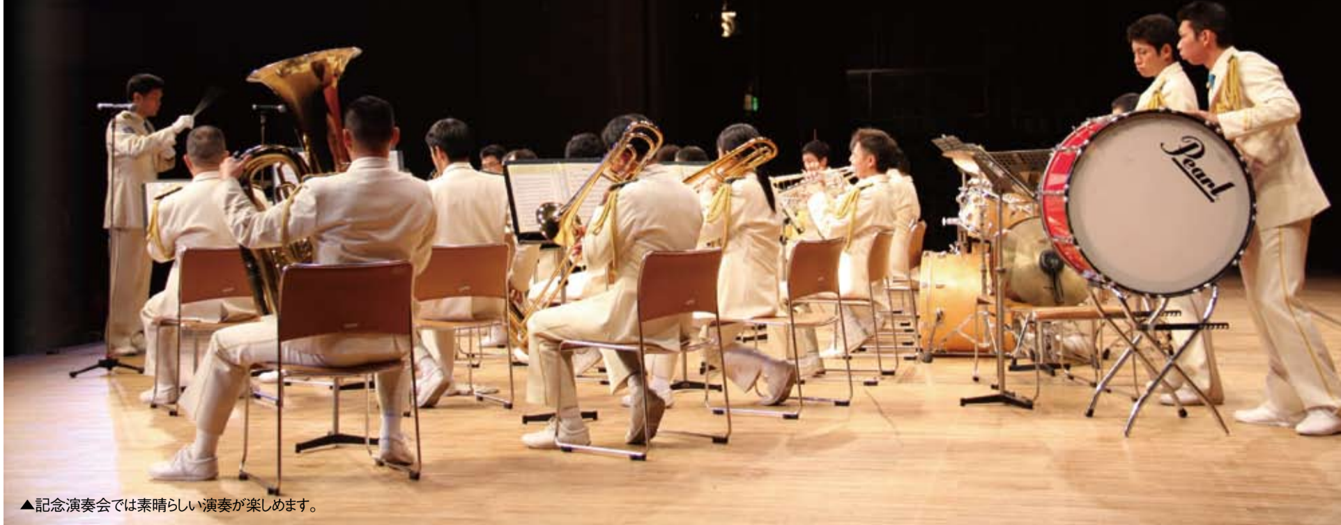
▲記念演奏会では素晴らしい演奏が楽しめます。