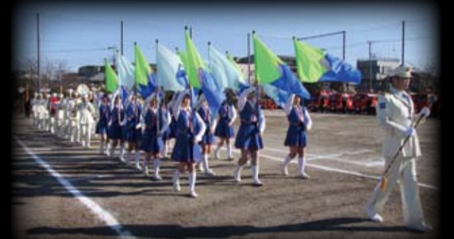
▲消防出初式で千葉県立市川昂高等学校吹奏楽部カラーガードと演奏行進する市川市消防音楽隊