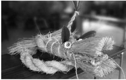
▲期間中は、実際にワラで作られた堀之内地区の辻切りの大蛇を展示

日 1月20日(日)～2月17日(日) ※1月21日(月)・28日(月)・2月4日(月)・12日(火)は休館