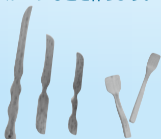
▲竹は、使い込むほどに味わいが出るなど、質感の変化も楽しめる

日 2月11日(祝)午後1時30分(受け付けは15分前から)~4時 人 20歳以上の方、先着40人 物 上履き、飲み物、小刀、キリ、ノコギリ ※工作道具は持参できる方のみで可 申 1月27日(日)までに、住所・氏名・電話番号を☎337-0533同施設(月曜日休館)