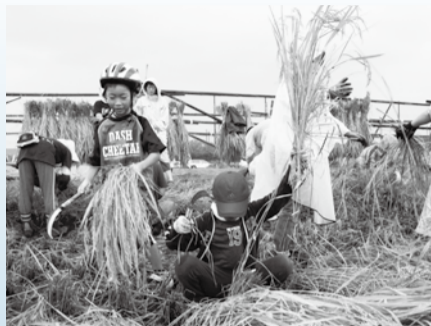
▲初めての稲刈りに夢中になる子どもたち ※4月3日(水)までに参加の可否を通知。4月13日(土)午前に説明会を開催。

市内の自然豊かな田園風景の中、親子で稲作を体験しませんか。「田植え」や「稲刈り」だけでなく、「防鳥ネット張り」「おだ作り」など、様々な作業を行うことができます。