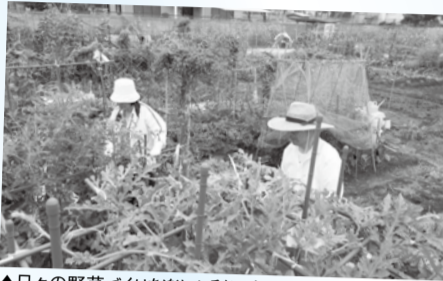
▲日々の野菜づくりを楽しむ利用者

家族や友だち同士で野菜や花などの栽培を楽しめる「市民農園」。今年3農園の利用者の入れ替えをします。