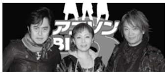
水木一郎 堀江美都子 影山ヒロノブ

アニソンBIG3スーパーライブ 2013 in 市川 6月2日(日) 15:00開演/文化会館大ホール/出演=水木一郎、堀江美都子、影山ヒロノブ/全席指定3,500円/500円引き/中学生以下1,000円引き/3歳未満はひざ上無料