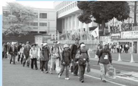
▲スポーツセンターでは、ゴール後に模擬店も楽しめる

春の陽気の中、市川市を中心とした名所・旧跡を歩いてみませんか。6kmの「水と緑の回廊コース」から33kmの「大町自然公園コース」まで、体力に合わせて全10コースを用意しました。なお、小学校低学年と幼児は保護者同伴、障害者は介助者の同行が必要です。