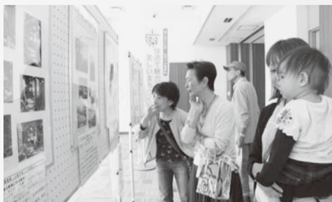
▲家族や友だちと庭の話で盛り上がる来場者

応募資格 応募者自身が維持管理を行っている市内のガーデニング作品。 ※幼児、小・中学生が応募する場合は、保護者と連名で応募してください