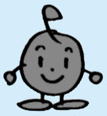
こどもエコクラブイメージキャラクター「エコまる」

クラス、友達、部活の仲間などでグループを作り、エコ活動を始めませんか。こども環境クラブに登録すると、環境に関する情報などが手に入るほか、メンバーで行くバスツアーや、活動報告会、壁新聞展示などのイベントに参加することができます。エコポイントをためるとエコまるグッズももらえます。なお、登録には高校生以上代表サポーターは20歳以上のサポーター1人が必要です。