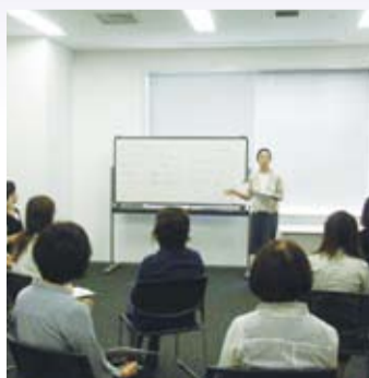
▲実習や質疑応答の時間を多くとる ワークショップ形式で実施