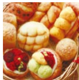
▲羊毛フェルトの作品(一例)

スクラップブックや羊毛フェルト・アロマなど、多様な資格の取得の仕方から教室の開き方までを、各経験者が10のブースで紹介。※体験有、一部材料費有料