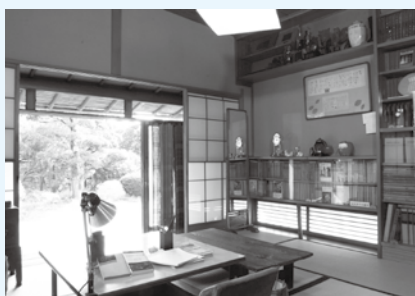
▲水木邸の書斎から庭をのぞむ

市川については「いつの間にか三十年、私は今までこんなに永く住んだ土地はない。知らぬ間に根が生えて、今では庭の樹木、果実花、みんな別れ難い存在になってしまった。」