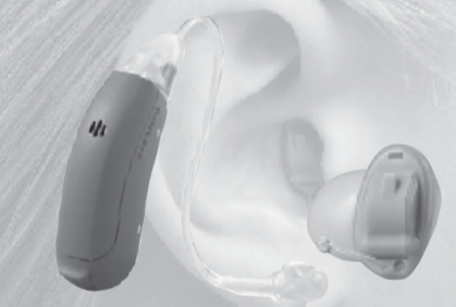
市川市役所正面・駐車場あります

自宅療養・入院中・高齢者施設入居など ご来店できない方、 無料出張 いたします。