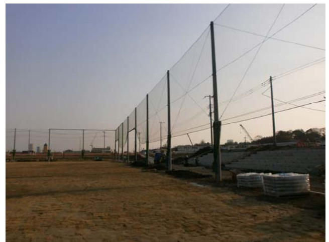
多目的広場は防球ネットも完成です