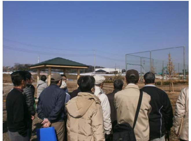
現場見学会の様子

今回の箇所は、これから約半年の芝の養生期間を経て、平成26年9月頃にオープンする予定です。皆様にご検討に加わっていただいた国分川調節池の公園整備も、形として現れ、いよいよオープンが近づいてきました。