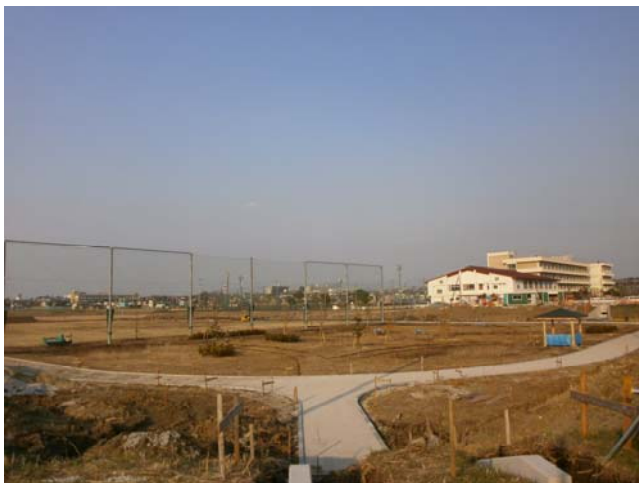
園路や四阿（あずまや）も出来ました