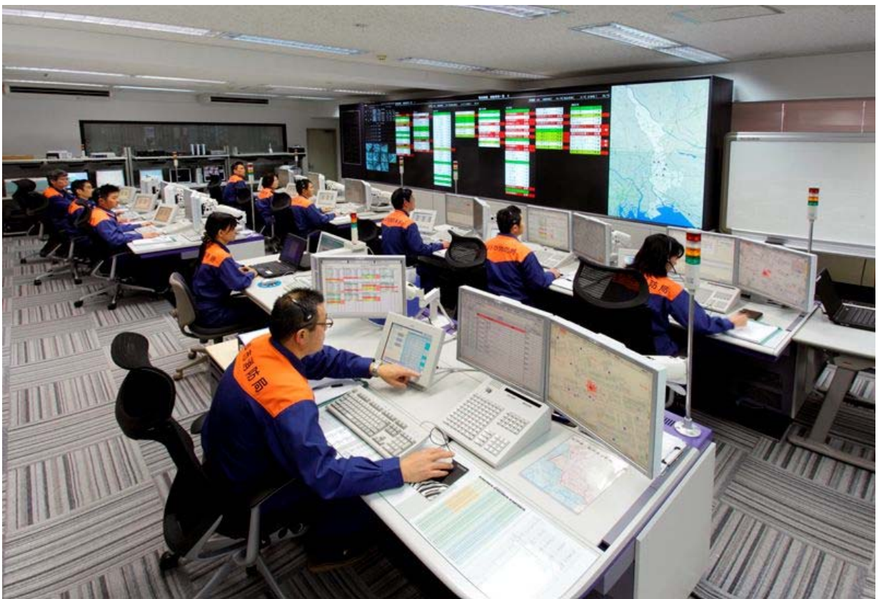
千葉北西部消防指令センター