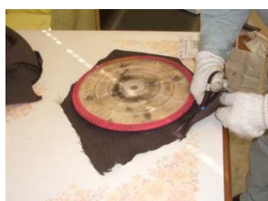
②(張り替え用布の裁断)