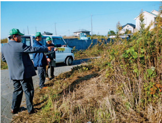
農業委員による「農地パトロールの様子」