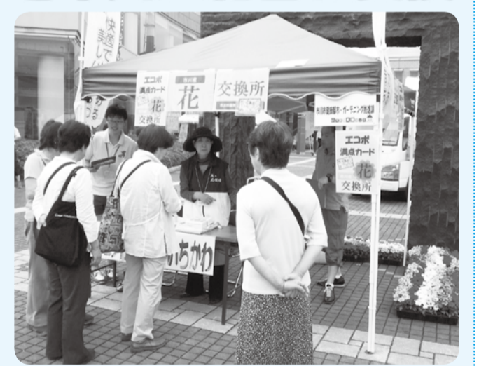
▲エコポ満点カードを花苗と交換

日 5月30日(土)午後1時～3時 場 駐Ⓜ 駐車場 交換品 エコポ満点カード1枚で、市川産花苗(ペチュニア、ニチニチソウ、トレニア)3苗1セット ※花苗の生育状況により、交換品が変更になる場合があります。花の種類や色の指定はできません。 ◆市内在住・在勤・在学の方、先着500セット※申し込みは当日引き取り可能な方のみ。 ◆往復はがきに必要事項(6面上段参照)と交換希望枚数(1人3枚まで)を書き、5月15日(金)まで(消印有効)にまちなみ景観整備課(〒272-8501)※住所不要 ☎704-0003 同課