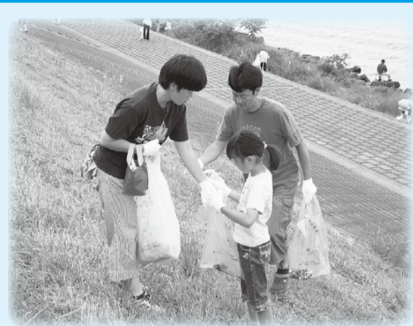
▲江戸川をごみのないきれいな川に

国土交通省と江戸川沿い2区11市町による恒例の江戸川クリーン作戦。収集されるごみは年を重ねるごとに減っており、この運動で街をきれいにしようという意識が着実に浸透しています。