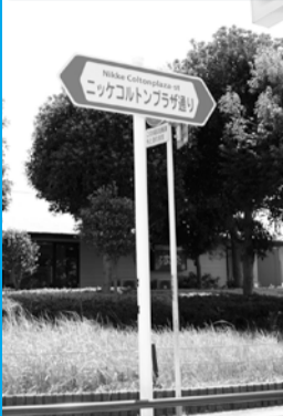
市道0117号 日本毛織株式会社 「ニックコルトンプラザ通り」