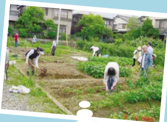
生ごみを資源として利用する堆肥利用方法の普及活動を通し、環境の保全を目指しています。