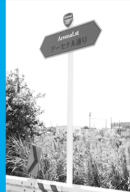
市道0127号 市川市スポーツクラブ 「アーセナル通り」

ネーミングライツとは、施設の名称や通称に企業名や商品名を冠する権利をパートナー企業に買い取ってもらい、その収入を財源とするものです。市では、市道の維持管理費用の新たな財源確保と、地域の活性化を目的として、法人を対象にネーミングライツ・パートナーを募集します。対象路線など、詳しくは市公式Webサイトをご覧ください。