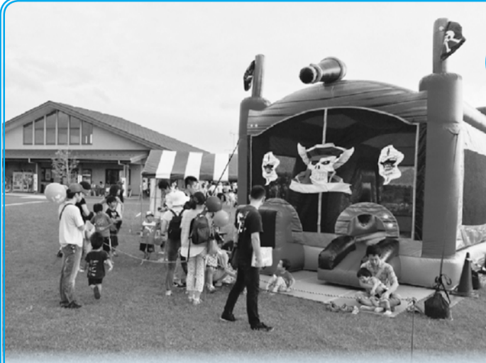
▲子どもに大人気のふわふわ遊具(写真は昨年の様子)

真間川流域の総合的な治水対策を紹介するイベントです。都市型の水害の仕組みを親子で学びませんか。 日 9月12日(土) 時間 午前10時～午後2時 ※荒天中止。当日は午前7時から ☎334-1111(自動音声)で開 催の有無をお知らせします。 場 大柏川第一調節池緑地及び大柏 川ビクターセンター(市民プール北) ※無料臨時駐車場あり。 内 総合治水に関するパネルや模型 の展示、絵画コンクール入賞作品の 展示、雨水浸透実験、かわクイズ、 ふわふわ遊具、スーパースポールす く、自然観察会、他 問 ☎712-6356水循環推進課