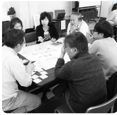
▲20代から70代まで、幅広い年代の方が議論した昨年度のワークショップ

市では、市役所本庁舎の建て替えを進めるにあたり、市民交流のきっかけを生み、活動の場所として設ける「市民活動支援スペース(仮称:協働テラス)」について、市民ワークショップを開催しています。平成26年度には、