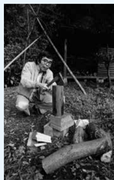
▲井上ひさし氏(2000年)

市在住の写真家、但馬一憲氏が撮影した池波正太郎氏、井上ひさし氏、浅田次郎氏、池井戸潤氏、リリー・フランキー氏などの文士の写真を撮影時のエピソードとともに紹介します。