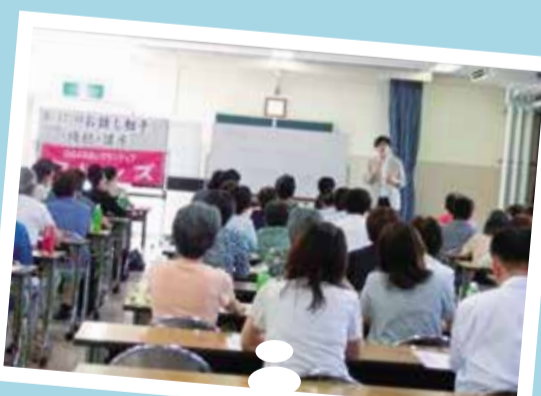
高齢者の方に寄り添う傾聴活動(話し相手)ができるよう育成講座を開催しています。