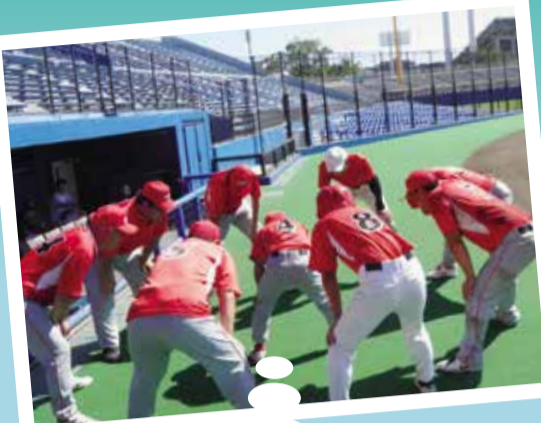
「障害があっても野球ができる」ことを知ってもらい、障害者スポーツが発展するよう、市民との交流事業を行っています。