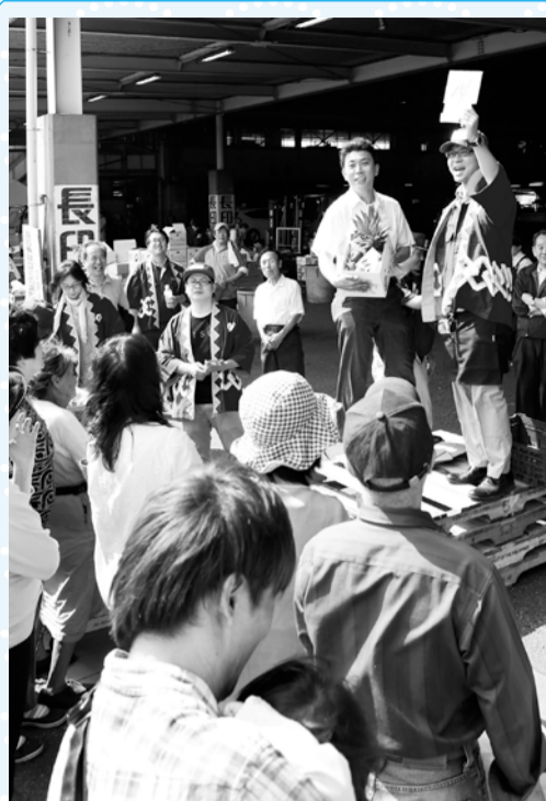
▲毎年盛況の「模擬競り」

2015 いちかわ市場まつり 青果や花き、乾物、お茶、食肉、鶏卵などの食料品や日用雑貨の販売を行います。模擬競りや焼きそば、ゲームの出店、その他のイベントもあります。 ※敷地内工事のため、車での来場は入場制限を行うことがあります。 日 9月27日(日)午前8時30分～正午 場 地方卸売市場 問 ☎3783611同市場