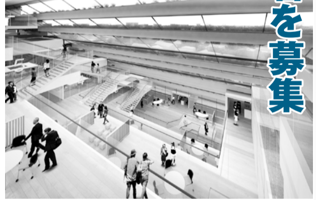
▲市民活動支援スペースのイメージ図

人全4回全てに参加できる市内在住の18歳以上の方、抽選で35人程度 甲 新庁舎建設課、総務課、大柏出張所で配布の申込書に、必要事項を書き、9月18日(金)必着で持参、郵送、またはFAXで新庁舎建設課。申込書は市公式Webサイトからダウンロード可。