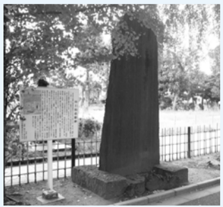
▲川上翁遺徳碑(葛飾八幡宮)

化研病院けんこう教室 糖尿病とは合併症を防ぐために 9月19日(土)①午前10時30分〜11時30分②午後2時〜3時(いずれも受け付けは1時間前) 場合同病院研究棟(国府台6の1の14)