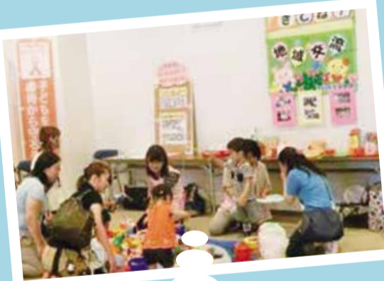
子育て中のお母さん方がつながり、悩みを解決できる場作りをしています。