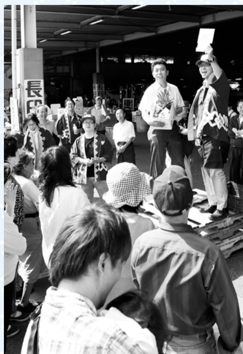
▲毎年盛況の「模擬競り」

青果や花き、乾物、お茶、食肉、鶏卵などの食料品や日用雑貨の販売を行います。模擬競りや焼きそば、ゲームの出店、その他のイベントもあります。