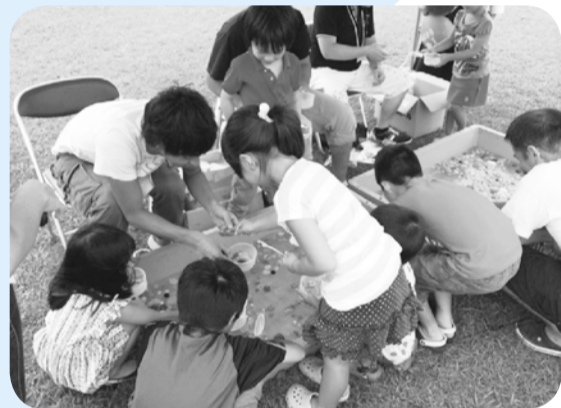
▲スーパースポールすくいに夢中

真間川流域の総合的な治水対策を紹介するイベントです。都市型の水害の仕組みを親子で学びませんか。 日 9月12日(土) 午前10時～午後2時 ※荒天中止。当日は午前7時から ☎334-1111(自動音声)で開 催の有無をお知らせします。 場 大柏川第一調節池緑地及び大柏 川ビクターセンター(市民プール北) ※無料臨時駐車場あり。 内 総合治水に関するパネルや模型 の展示、絵画コンクール入賞作品の 展示、雨水浸透実験、かわクイズ、 ふわふわ遊具、スーパースポールす く、自然観察会、他 問 ☎712-6356水循環推進課