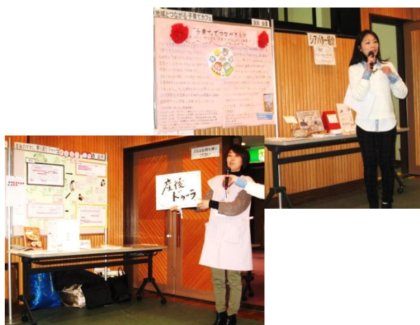
（パネル展示プチプレゼンテーションの様子） - 1 -