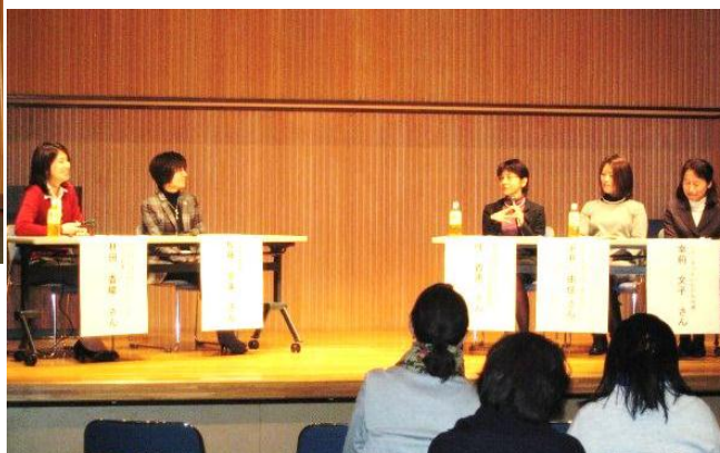
（パネルディスカッションの様子）