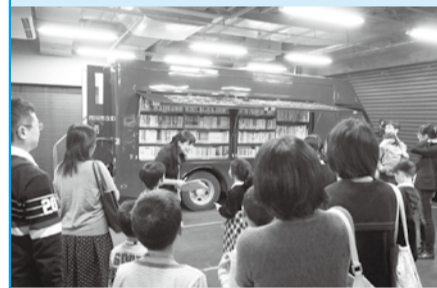
▲自動車図書館みどり号も見ることができます