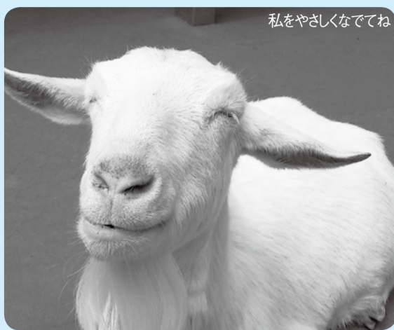
私をやさしくなでてね

動植物園の「なかよし広場」で触れ合うことができる人気者、白いヤギについて飼育員がお話します。