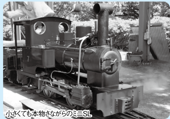
小さくても本物さながらのミニSL

日 10月12日(祝) 午前10時30分～正午、午後1時～2時30分 場 動植物園内ミニてつ広場 ¥入園料と乗車券(1回100円)