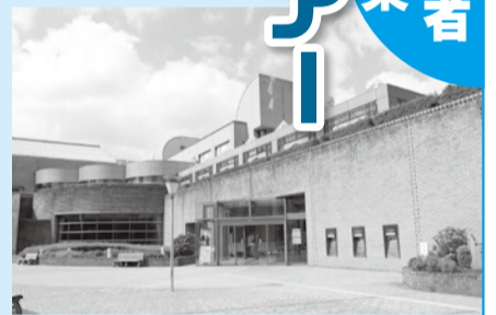
▲いつもとは違う一面を見に行きませんか

日 10月25日(日)午後3時～4時 場 中央図書館 人 先着20人(小学生以下は要保護者同伴) 申 直接同館窓口へ。 問 ☎320-3346同館