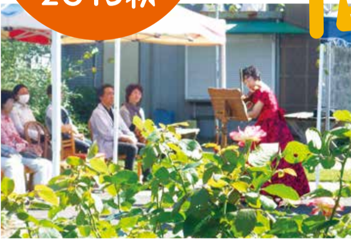
庭園で聞く音楽は一味違って聴こえるかもしれません。心癒されるメロディーと雰囲気には浸りませんか。