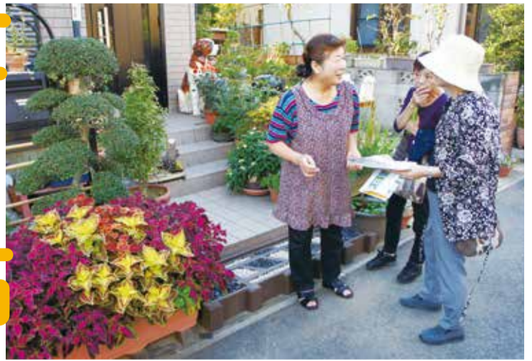
庭づくりの苦勞話に楽しい話など、弾む会話にあふれる笑み。出会いやおしゃべりはオープンガーデンのだいごみです。