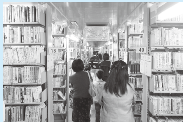
▲たくさんの方が並ぶ様子は圧巻です

図書館の書庫の中やおはなし室の中など、普段一般の方は入ることのできない図書館の裏側を司書が案内するバックヤードツアー(歩いての見学)を開催します。