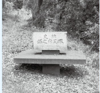
▲大量の貝殻が露出する堀之内貝塚

堀之内貝塚は、ラップのような形をした堀之内式土器を出土することで知られていますが、埋葬された人骨が完全な形で見つかったのはじめての遺跡でもあり、昭和四二年に国の史跡に指定されています。昭和四七年に開館した考古博物館には、堀之内貝塚から出土した土器・石器・土偶・人骨などのほか、生活の様子を復元したジオラマ、貝塚の立体模型などが展示されています。博物館で事前学習してから見学することをおすすめします。