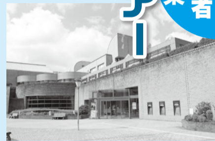
▲いつもとは違う一面を見に行きませんか