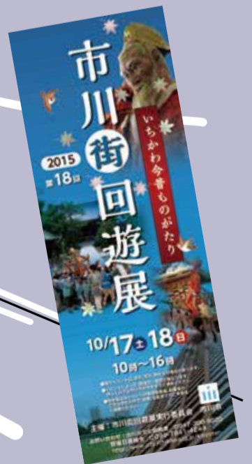
▲スタンプ設置場所の詳細が分かる公式パンフレット