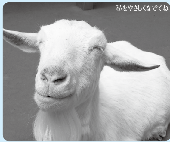
私をやさしくなでね

動植物園の「なかよし広場」で触れ合うことができる人気者、白いヤギについて飼育員がお話します。