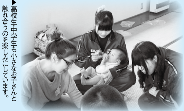
▲高校生中学生も小さなお子さんと触れ合うのを楽しんでいます。

日①10月28日(水)②30日(金)③11月4日(水)④6日(金)①午前9時30分～11時20分②④午前9時45分～11時35分 場高谷中学校 入乳幼児親子、各日20組事前ガイダンスへの参加が必要 申④376-1118または直接、南八幡こども館