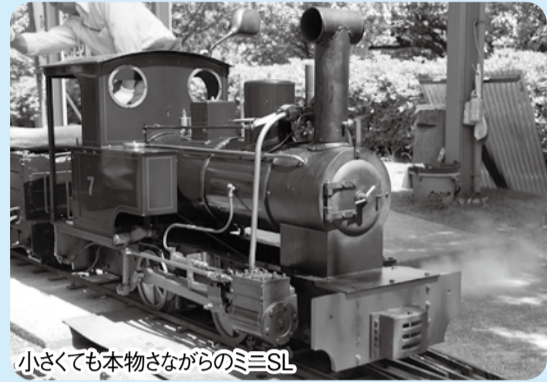
小さくても本物さながらのミニSL

日 10月12日(祝) 午前10時30分～正午、午後1時～2時30分 場 動植物園内ミニてつ広場 ¥入園料と乗車券(1回100円)