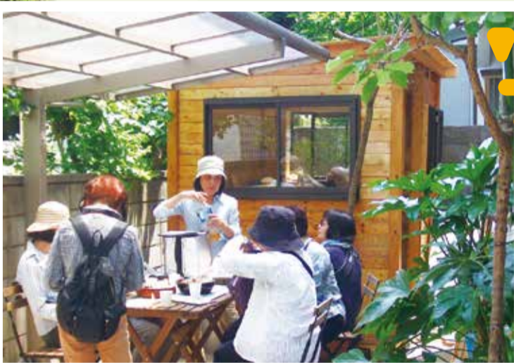
談笑したり、のんびりしたり、思い思いの休息に美しい庭が花を添えてくれます。