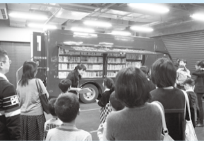
▲自動車の図書館みどり号も見ることができます