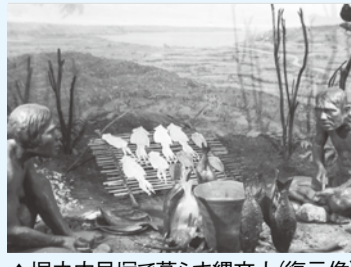
▲堀之内貝塚で暮らす縄文人(復元像)