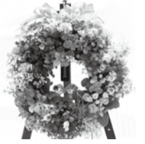
▼昨年の大賞受賞作品

大賞を決定後、表彰式を行います。 申 申込用紙に必要事項を書き、10月31日(土)必着で☎まち並み景観整備課に持参またはFAX。※申込用紙は、☎まち並み景観整備課、☎総務課、大柏出張所、南行徳市民センター、メディアパーク市川、各公民館で配布する他、市公式Webサイトからもダウンロード可。