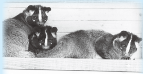
▲ZOOワンポイントガイドは「かわいい困り者」ハクビシンをクローズアップ

11月15日(日)午前9時30分～午後4時30分 入園料のみ(高校生以上430円、小中学生以下は無料) ☎3308-1900同園