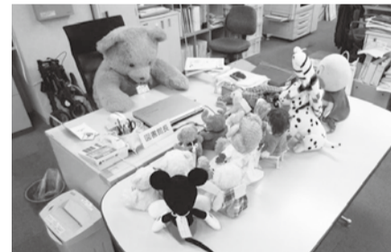
▲子どもたちに本と図書館を好きになってもらえるよう今年も開催します

ぬいぐるみと一緒におはなしを聞いた後、ぬいぐるみたちが図書館に泊まり、探検をします。 日 12月5日(土)午後2時～3時 内 おはなし会後にぬいぐるみを預かります。12月12日(土)午前10時～正午にぬいぐるみを迎えに来てください。 場 こどもとしゃかん 人 市内在住・在園・在学の3歳～小学生、先着30人 申 11月11日(水)10時からこどもとしゃかんカウンターに直接申し込みまたは電話 問 ☎320-3346中央図書館