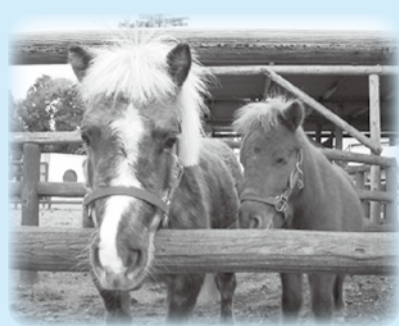
▲ポニーとの記念撮影会「みんなでパチリ」ではスタッフがシャッターを押します

動植物園では輪投げやフワフワトランポリン、自然博物館ではドングリ人形キット配布、少年自然の家ではプラネタリウム投影など、いろいろなイベントを開催します。当日は「家族の日」で、小中学生以下の入園が無料になります。