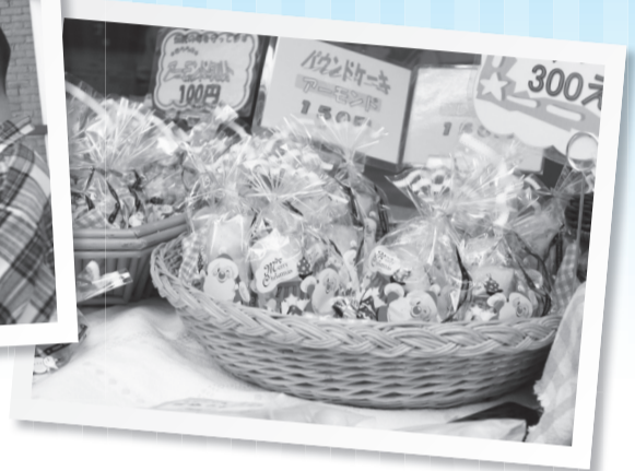
▼事業所で作られた食品などは、市役所でも販売されています