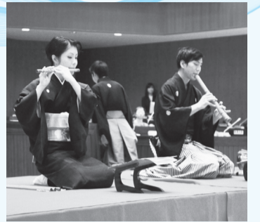
▲邦楽のコンサートを楽しみましょう