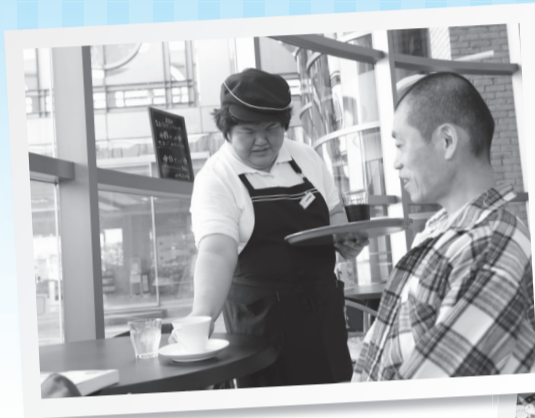
▲開放感ある店内で飲食が楽しめる「カフェテラスびっころ」