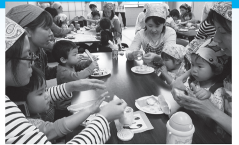
▶みんなで作って、食べると楽しいな

みんなでバターを作っ てクラッカーと一緒に食べ ながらクリスマス会を楽し みましょう。子どもの手形 でクリスマスリースも作り ます。