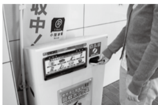
▲黄色いボックスが目印

設置場所 市役所、行徳支所、南行徳市民センター、大柏出張所、市川駅行政サービスセンター、メディアパーク市川、市川南仮設庁舎、クリーンセンター、各公民館