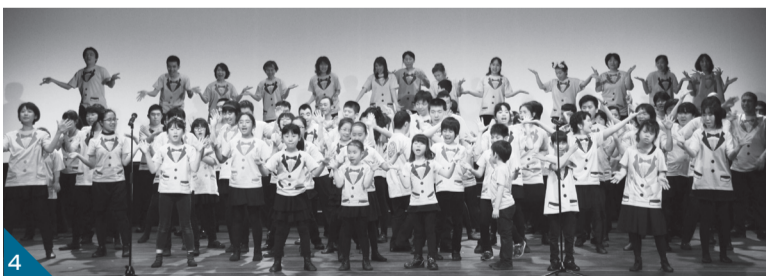
▲①たくさんの中からお気に入りの一品を見つけてはいかがでしょう②あなたの一票が優勝を決めるI♥1グランプリ③盲導犬の仕事の間近で見ることが出来る機会です④生き生きと歌う姿は圧巻です

ミュージカル・体験企画など 場ニッケコルトンプラザコルトンホール(鬼高1-1-1)