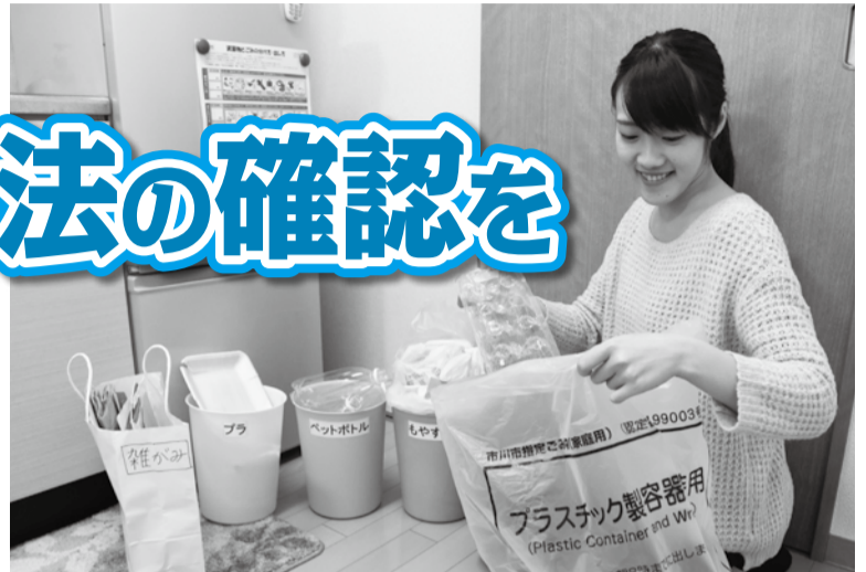
▲トレイやペットボトル、たまごのバックなどは、プラスチック製容器包装類の指定袋(写真右)に、封筒などの雑がみは、紙袋(写真左)に入れて出しましょう。