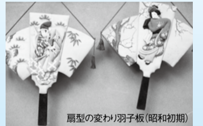
扇型の変り羽子板(昭和初期)

日 1月9日(土)～2月7日(日)の金・土・日曜日、午前9時30分～午後4時30分(入館は午後4時まで)