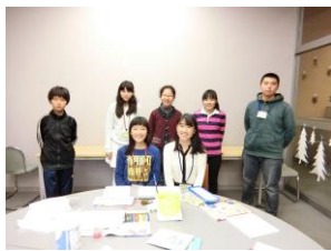
当日集まったメンバーです。

2015年12月25日に開催、個人で、またはグループで、オリジナルの本をつくりました。個性とアイデアあふれる作品が出来上がりました！展示期間中、これらの本は館内でご来館の方々に見ていただきました♪ (『』は作品のタイトルです。)