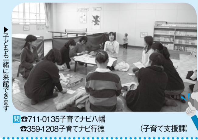
子どもと一緒に来館できます (子育て支援課)