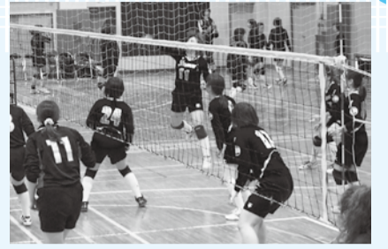
▲日頃の練習にも熱が入ります

オリンピックメダリストや、世界大会出場者、全日本チーム経験者などからなるドリームチームが来場し、バレーボールを用いたアトラクションや市バレーボール協会選抜チームとのフレンドリーマッチなどを行います。本事業は、宝くじの普及広報事業として行います。