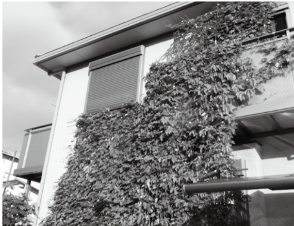
▲厳しい暑さを和らげます

窓などにあさがおやゴーヤなどのツル性植物をはわせて、太陽光を遮ることで、エアコンなどのエネルギー使用量を減らします。