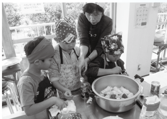
▲保温調理法に挑戦

市から委嘱された推進員が、家庭や地域で取り組める、環境にやさしい生活(エコライフ)を広める活動をしています。