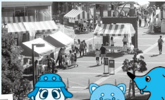
◀ 昨年の環境フェア 来場しました 約8,800人が