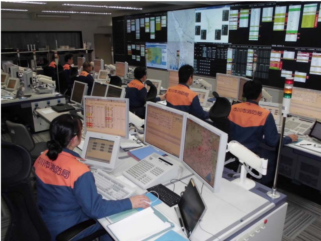
千葉北西部消防指令センター