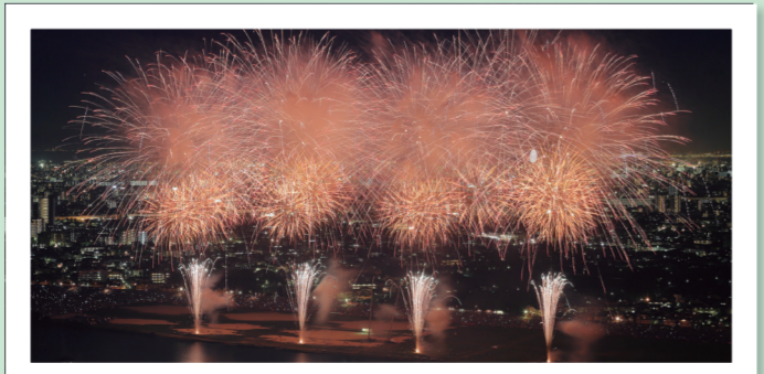
▲8つのテーマで構成された彩り豊かな花火が舞い上がります