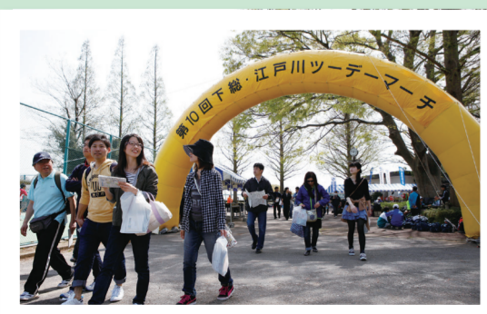
▲春の日差しの中、さわやかな汗を流せるツーデーマーチ