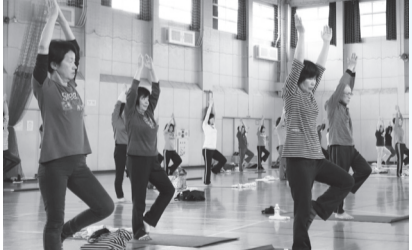
▲ヨガで楽しく健康づくり