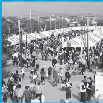
▲毎年さまざまな企画や店舗で賑わう市民まつり

◆行財政改革大綱 第2次アクションプラン 市では、平成25年度から行財政改革大綱に基づき、大綱の基本方針を実現するための推進計画である「第1次アクションプラン」による取り組みを進めてきました。今年度からは第1次アクションプランでの取り組みを踏まえて新たに「第2次アクションプラン」を推進していきます。詳しくは市公式Webサイトや市政情報センターでご覧ください。 ☎334-1105行財政改革推進課