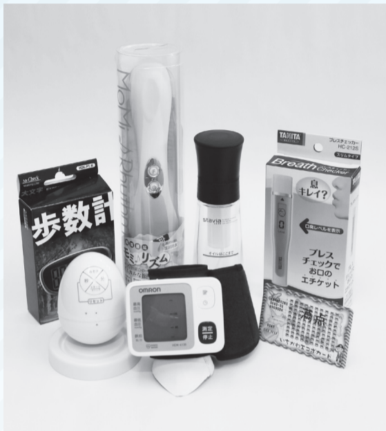
▲血圧計(150ポイント)やマッサージ器(100ポイント)、歩数計(50ポイント)など、健康づくりに役立つ景品に一新。