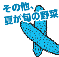
その他、夏が旬の野菜