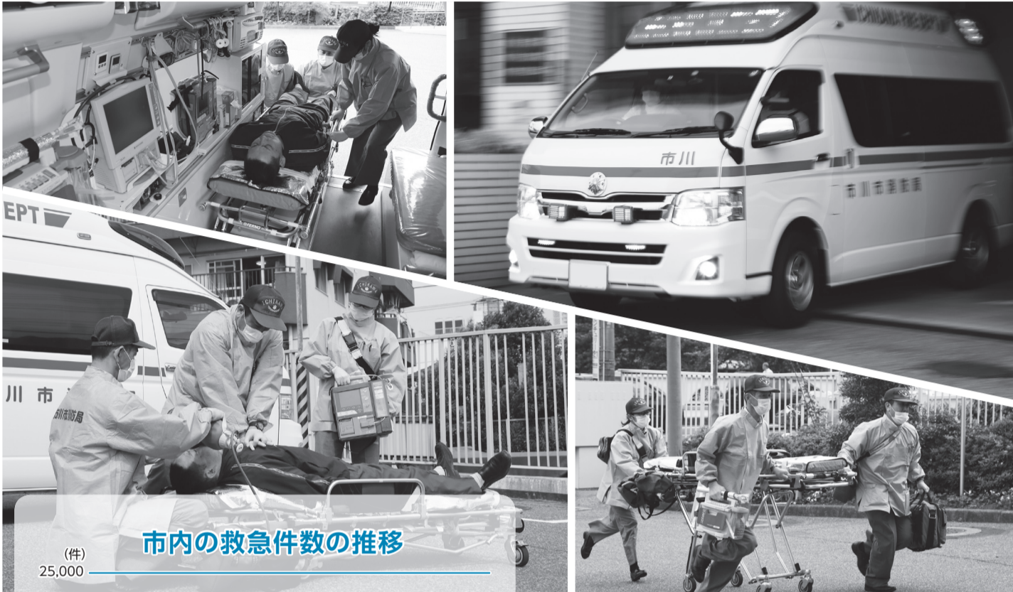
市内の救急件数の推移

防災行政無線テレホンサービス ☎0180-994-889 放送の内容が聞こえなかった時や確認したい場合にご利用ください。ただし、利用には通話料がかかります。(地域防災課)