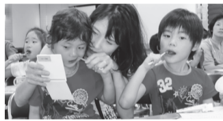
▲よく磨けたか鏡でチェック

骨よりも硬い「歯」。むし歯になるとどうなるのか、お子さんと一緒に実験をしてみませんか。お子さんの大切な歯をむし歯にしないよう、親子でぜひ参加してください。