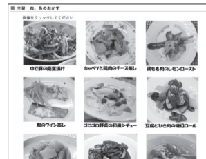
▲野菜や汁物・肉料理などのレシピがそろった市公式Webサイト

味付けや付け合わせに長ネギや青ジソなどの香味野菜を使うと、風味が増し、少ない調味料でもおいしく食べられます。市公式Webサイトにも約60品の適塩レシピを掲載しているので、ご覧ください。