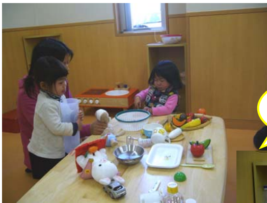
ままごとコーナー