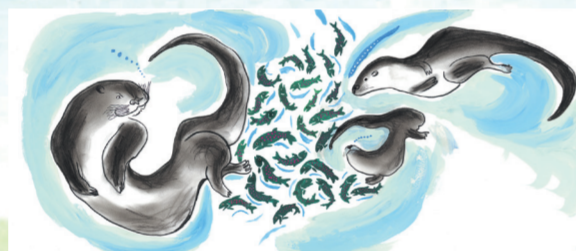
あべ弘士「かわうそ3まふたい」(小峰書店)平成21年