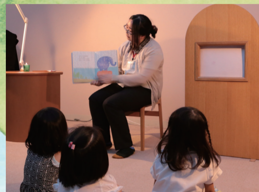
▲どんな動物が出てくるかな

図書館司書によるあべ弘士氏の絵本の読み聞かせと、動植物園飼育員によるカワウソの話、動物クイズなど。