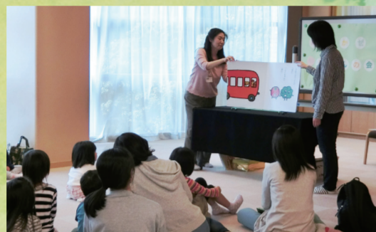
▲動物クイズで動物博士を目指そう

日 7月31日(日) 午後2時~2時30分 内容 あべ弘士氏の絵本の読み聞かせ 動物クイズ 動植物園飼育員による「カワウソ」の話 人 4歳~小学生