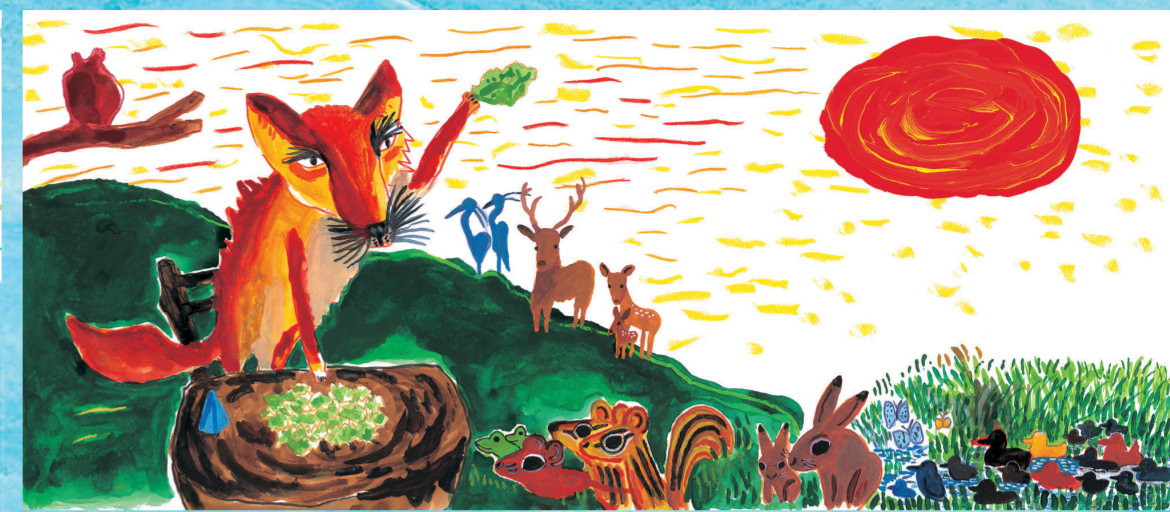
あべ弘士「絵「どうぶつさいばん」タンチョウは悪代官か?」(備成社)平成18年