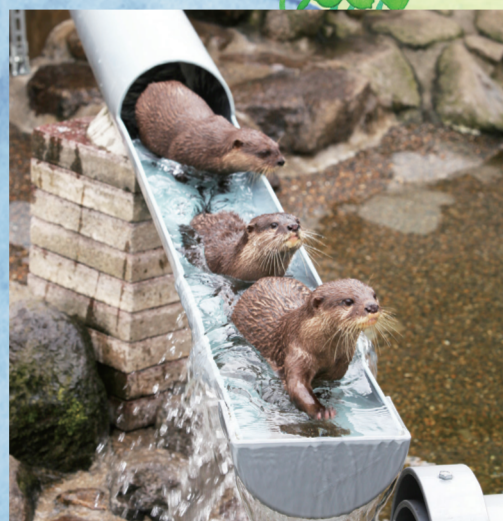
▲コツメカアソも順にお出迎え

日 8月6日(土) 午前10時~午後3時 人 小学1~2年生、抽選で15人程度 小学3~4年生、抽選で10人程度 小学5~6年生、抽選で10人程度 申 往復はがきに必要事項(6面上段参照)と学校名、学年を書き、7月9日(土)(必着)で動植物園(〒272-0801大町284-1外)