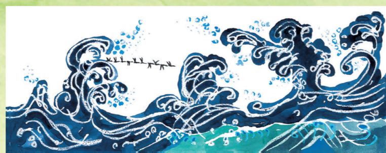
あべ弘士「新世界へ」(備成社)平成24年