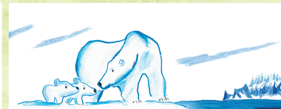
あべ弘士「ふたごのしろくま ねえ、おんぶのまき」(講談社)平成24年