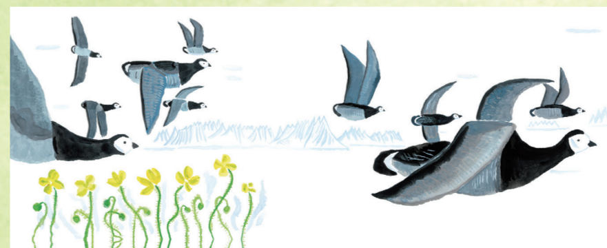
あべ弘士「新世界へ」(備成社)平成24年