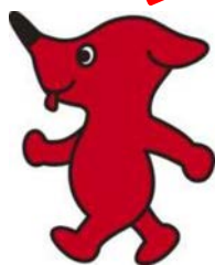
千葉県PRマスコットキャラクター チェバくん

◆申込み 10月1日(土)から中央図書館インフォメーションカウンターで直接お申込みください。