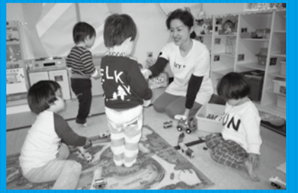
▼保育の現場に一步踏み出してみませんか

市内の公立保育園で実習ができます。保育士資格を持っているが保育現場で働いた経験がない方、プランクがあり自信がないという方、実際に保育の現場で働き、子どもたちと直接触れ合ってみませんか。補助的に保育の現場に携わり、就労のシミュレーションができます。詳しくは、市公式Webサイトをご覧ください。 待遇＝1日6時間、実習期間10日間、時給1,200円 ☎711-1792 子育て支援課