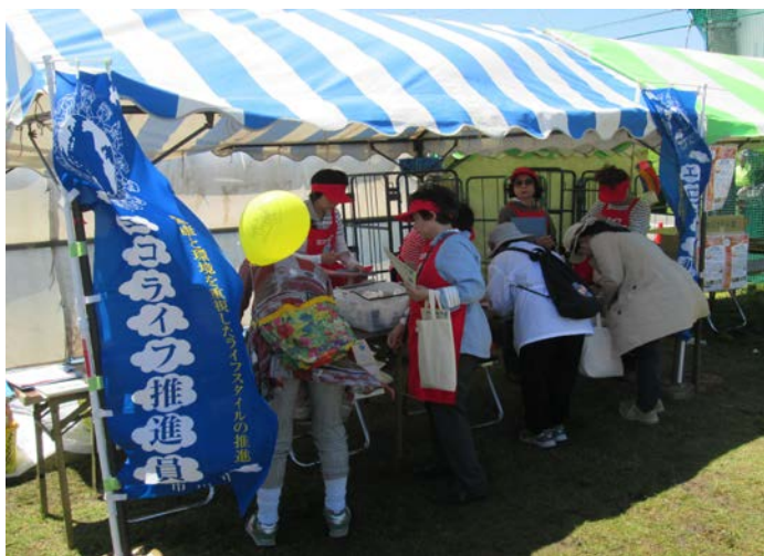
鯉のぼりフェスティバルでの啓発風景