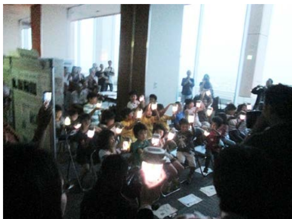
ソーラーランタン点灯式のようす

平成27年度は、7グループ118人が登録し、6月に、アイ・リンク展望施設で、発足式を開催したほか「ソーラーランタンづくり」や「クールスポットめぐりと星空観察会」、「冬の野鳥観察会」などを開催し、参加者は延べ91名でした。