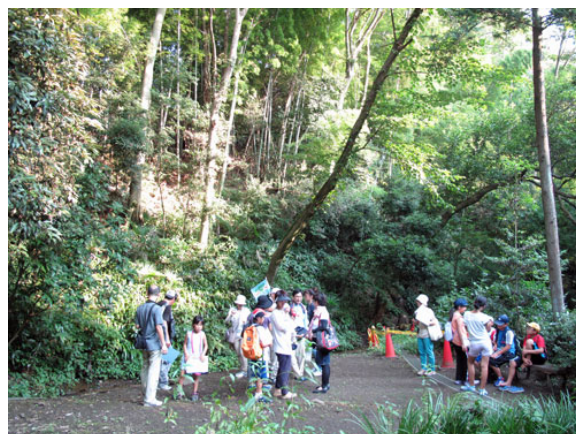
クールスポットめぐりのようす