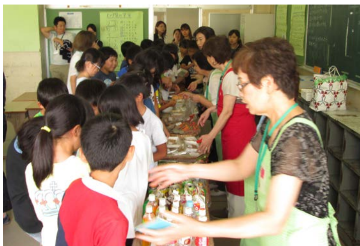
小学校での啓発風景