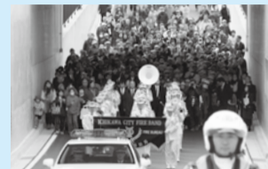
11月10日に行われた開通式での通り初め