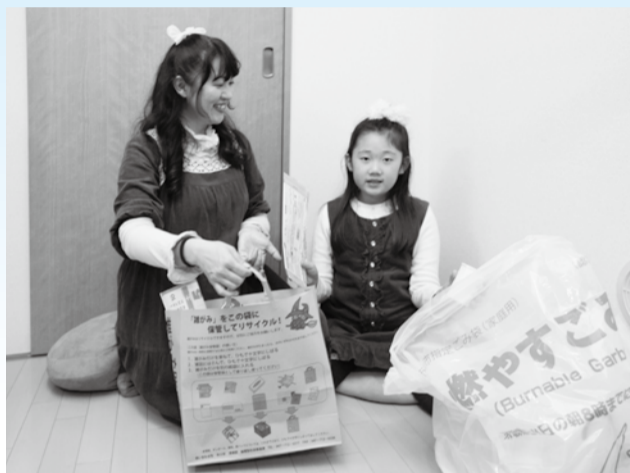
▲燃やすごみと雑がみ、どちらに入れるか分かるかな

年の瀬を迎え、クリスマスや年越しの準備などでごみが増える時期となりました。そこで、年末年始の資源物とごみの収集日や分別・排出方法についてお知らせします。