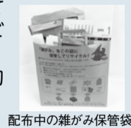
配布中の雑がみ保管袋