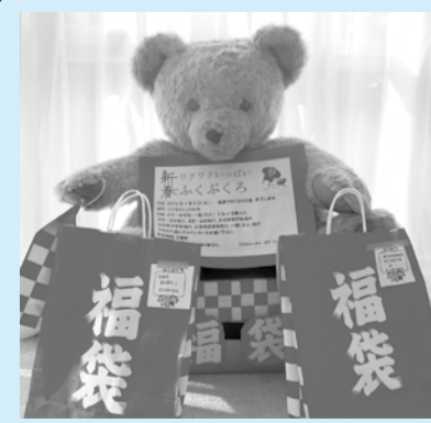
▲新春福袋で新テーマにも挑戦しよう

図書館員が、いろいろなテーマで選んだ本を福袋にして貸し出します。どんな本が入っているかは、借りてからのお楽しみ。一般・中高生向け、子ども向けがあります。普段手にしない本から新しい世界が広がるかもしれません。本のプレゼントではありません。 貸出期間2週間 ☎中央図書館 こどもとしよかん・行徳図書館 1月5日(木)午前10時から、信篤図書館 1月5日(木)午前9時30分から 各館とも、福袋がなくなり次第終了。詳細は各館までお問い合わせください。 場内中央図書館・こどもとしよかん・行徳図書館 (一般向け・中高生向け・子ども向け) 信篤図書館 (一般向け・子ども向け) ☎320-0334 中央図書館