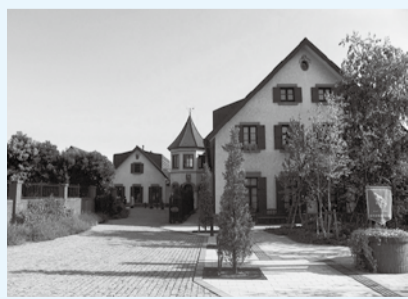
▲東山魁夷記念館外観

東山魁夷記念館では、「人間・東山魁夷」をコンセプトに、日本画作品のほか、愛用品や直筆の書状など貴重な資料を展示し、東山魁夷の人となりを紹介しています。 2階の作品展示では、東山魁夷とともに革新の精神をもつ新しい日本画の伝統を築き、戦後の日本画壇を牽引した彌生会会員7名の代表作を堂に集め、かれらの多彩な日本画作品を東山魁夷の作品とともに楽しみいただきます。東山魁夷記念館で珠玉の芸術に触れて、贅沢な一日を過ごしてみたいかがでしょうか。