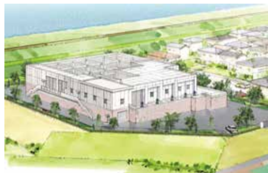
▲大和田ポンプ場の完成イメージ

平成29年度完成予定の東京外かく環状道路は、公共下水道などの都市基盤整備にも大きな役割を果たしています。道路整備の進展に伴い、4月には雨水を江戸川へ排出する大和田ポンプ場が完成し、周辺地域での浸水被害への備えが強化されます。