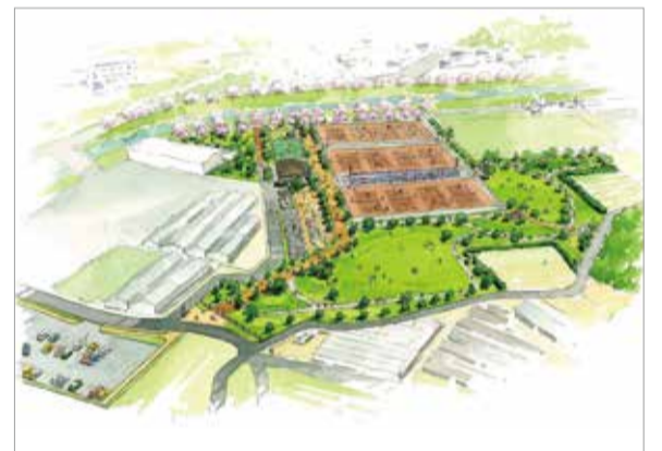
▲(仮称)北市川運動公園の完成イメージ