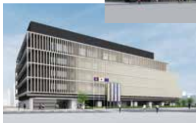
◀新第2庁舎イメージ