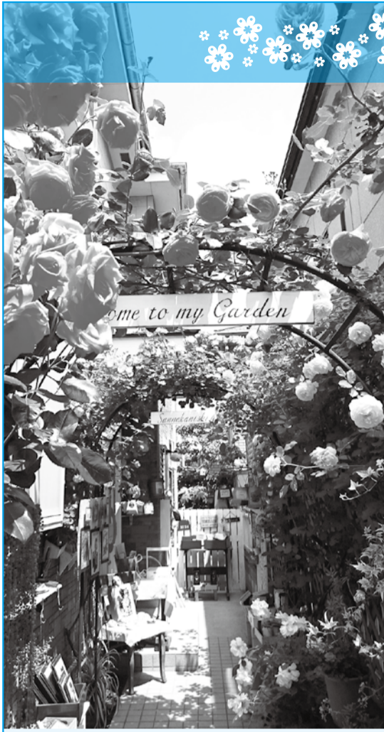
▲美しい花に心が安らぎます

ガーデニングの魅力を堪能できるいちかわの祭り「まちなかガーデニングフェスタ2017春」の参加者を募集します。募集内容は丹精込めた庭や花壇を公開いただく「オープンガーデン」と、花や庭にちなんだ「ガーデニングイベント」です。