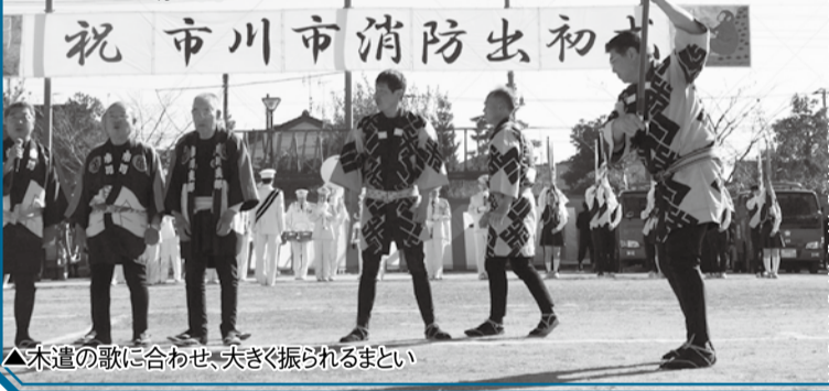
▲木遣の歌に合わせて、夫きぐ振られるまとい

場 大洲防災公園 問 ☎3333-2149消防総務課 日 1月7日(土) 午前9時30分～11時30分 30分荒天中止。当日午前6時から☎3333-3636で確認可 部隊観閲や消防功労者表彰が行われる他、木遣、まとい振りなどの伝統的な消防技術も披露されます。また、消防音楽隊の演奏、子ども用防火服を着ての記念撮影、地震体験車の搭乗、資機材及び救助工作車の展示、記念撮影コーナーなどもあり、子どもも楽しめる催しです。