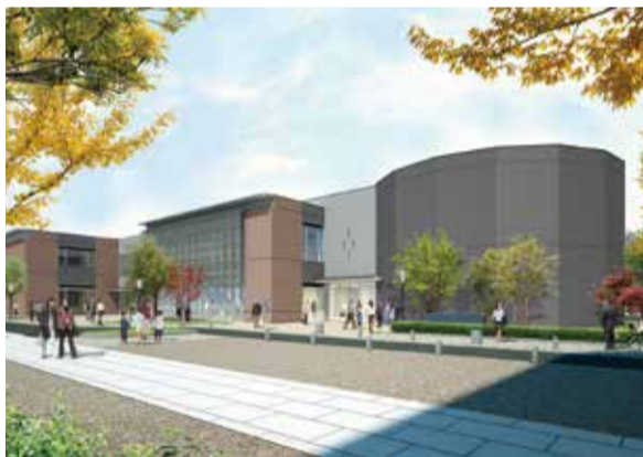
新第1庁舎イメージ▶

3月に新たに開館する「八幡市民会館」は、ホールや展示室などを備え、市民のみなさんのサークル活動や発表の場として利用できる施設となります。