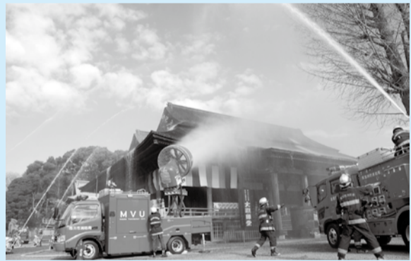
▲文化財を守るための一斉放水

(昭和24年1月26日に奈良県の法隆寺金堂が炎上し、国宝の十二面壁画が焼損したことに基づき、1月26日が文化財防火デーと定められました)