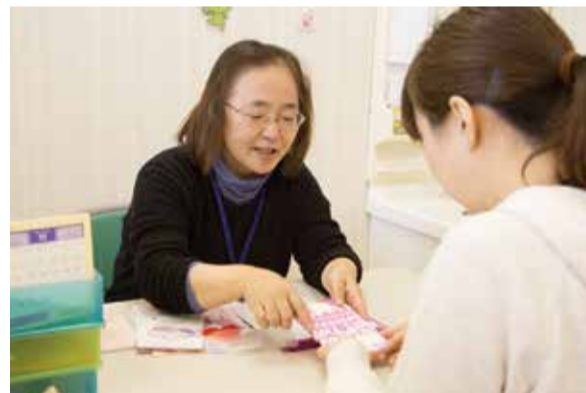
▲妊娠から出産・子育てまで切れ目なく、専門職が相談に応じる「アイティ」

昨年から始まった母子保健相談窓口「アイティ」や祖父母と子育て世帯の同居・近居を応援する多世代家族支援など、幅広い視点での子育て支援を継続して進めます。