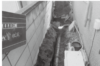
▲排水設備接続工事着手前・完了後は、必ず市に届け出をしましょう

下水道の接続工事や使用開始にあたり必要な届け出のない「無届接続」が市内で見受けられました。市では、この無届接続などの再発を防止するため、事業者への規制の強化など、下水道事業の健全な運営確保に向け、平成28年12月に下水道条例を一部改正しました。