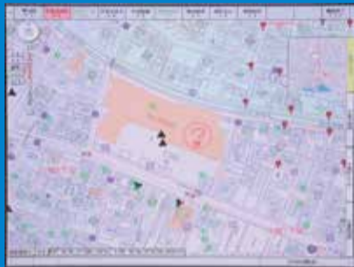
▲GPS機能で場所を特定

GPS機能を活用して、現場に一番近い市内の車両が出動しています。構成市の境界付近における災害に対しては、火災などが発生している市とほぼ同時に応援市にも指令がかかり、時間の短縮を図っています。