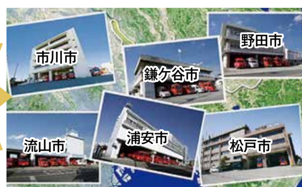
▲1分1秒でも早く指令を各市へ