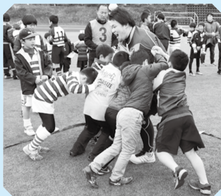
▲力を合わせて選手に勝とう