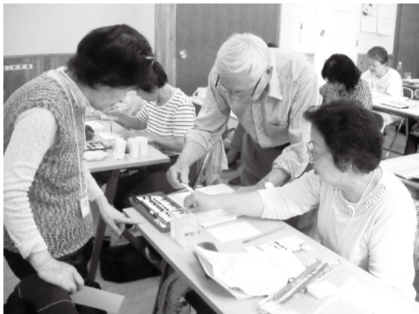
▲趣味を通じて仲間が増えます

いきいきセンター9施設で、60歳以上の方を対象に「シニアカレッジ」を開講します。初めていきいきセンターを利用する方は、最初に身分証をお持ちの上、利用施設での登録が必要となります。