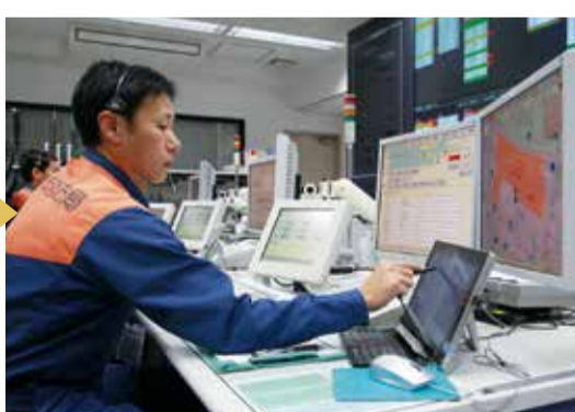
▲「119番消防です。火事ですか。救急ですか」