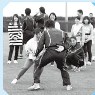
▲タグラグビーは女性にも大人気