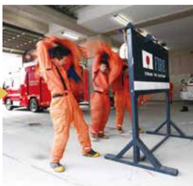
▲1分以内で防火衣着装