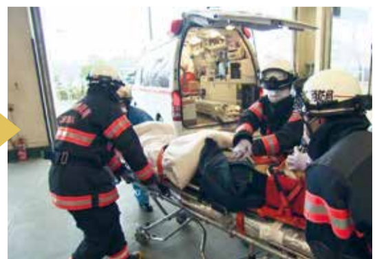
▲「国民の生命・身体・財産を守る」を信条に活動