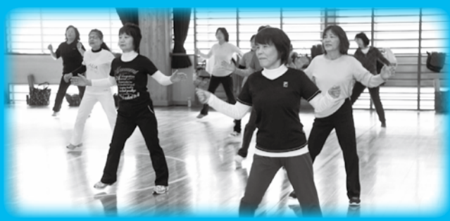
▲思い切り体を動かし健康な体をつくりましょう