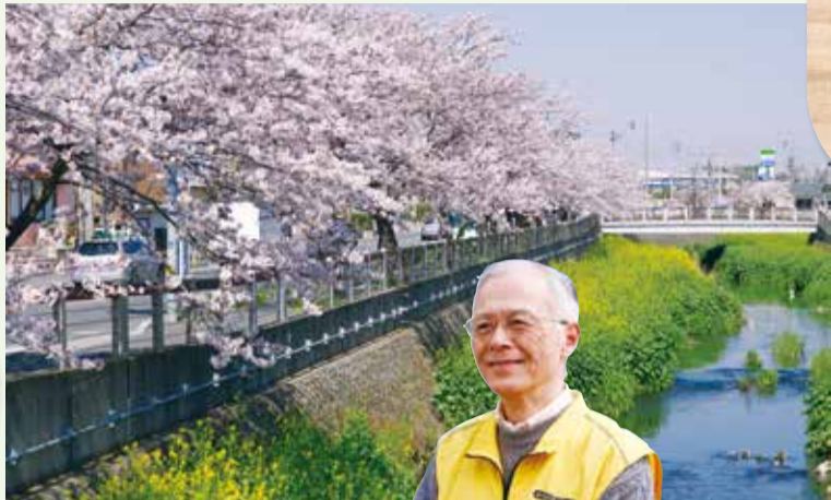
▲北東部を流れる大柏川沿いの桜並木