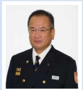
消防局長 高橋 文夫

近年、社会環境の変化により、各種災害が複雑多様化し、私たち消防に求められるニーズが増大しています。このようなことから消防局では、消防指令業務の共同運用をはじめ、消防力の充実強化を図るとともに、市民のみなさんのさらなる安全・安心の確保に向け、誠心誠意努力します。