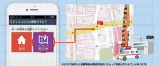
▲外出先からでも今いる場所を、簡単操作で知らせます

本市では、聴覚や言語に障害がある方が携帯電話のインターネット接続機能を利用して119番通報を行う「Web119」を導入しています。今年5月以降には、通報者が居場所を携帯画面に映し出される地図から指定できるなど、さらに便利に、そして操作が簡単になる「NET119」の導入を予定しています(使用には登録が必要)。NET119登録説明会については、4月中に本紙でお知らせします。