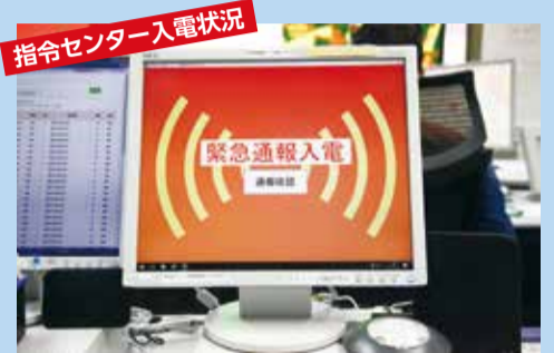
▲Web119からの通報は、音と光で知らせてくれます