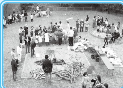
▲縄文時代を体験できるイベントが盛りだくさん