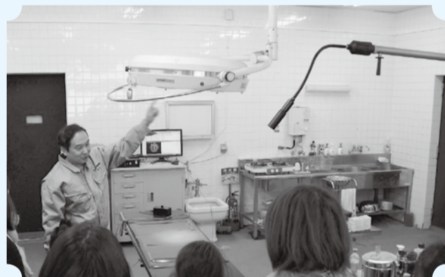
▲獣医さんの説明はおもしろく、分かりやすい

動物園にまつわる、ちょっと大人向け(子どもの参加可)のお話をします。今回は「動物園の動物病院ってどんなところ。獣医さんの仕事って」をテーマに動物病院を見学します。