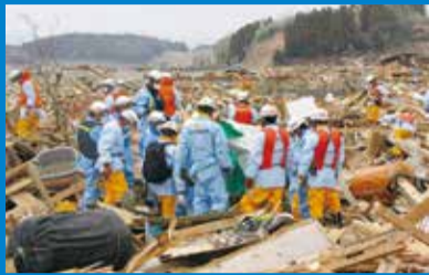
▲東日本大震災の様子

大規模災害時に集中する通報に対し、多くの職員で対応できます。また被害状況などを構成市で共有でき、国や県、関係機関との連携強化にもつながっています。