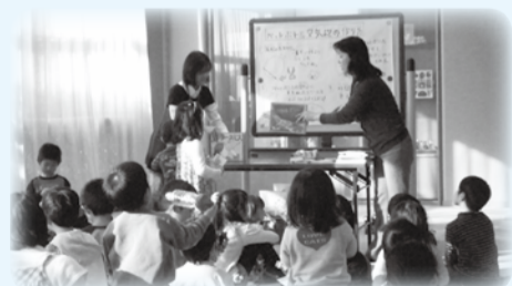
▲楽しく科学を体験しよう

「絵本に描かれていることを実際に体験できたら」と思ったことはありませんか。今回は、ペットボトルの空気砲などを作って、親子で科学遊びをします。絵本を読むだけでは分からなかった新しい発見があるかもしれません。 日 3月18日(土) 午後2時開始5分前までに集合 場 こどもとしよかん 人 小学生以下の子どもと保護者 問 ☎320-3334 同館