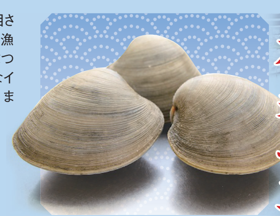
ホンピノス 本美之主

北米からやってきたホンピノスは味の良さが注目され、現在は主に東京湾で漁獲されています。市川漁港での漁獲量もトップクラスであり、いちかわ市民まつりや行徳まつりなど様々なイベントで販売しています。また、干貝や酔っ払い漬けなどの加工品としても1年中味わえます。