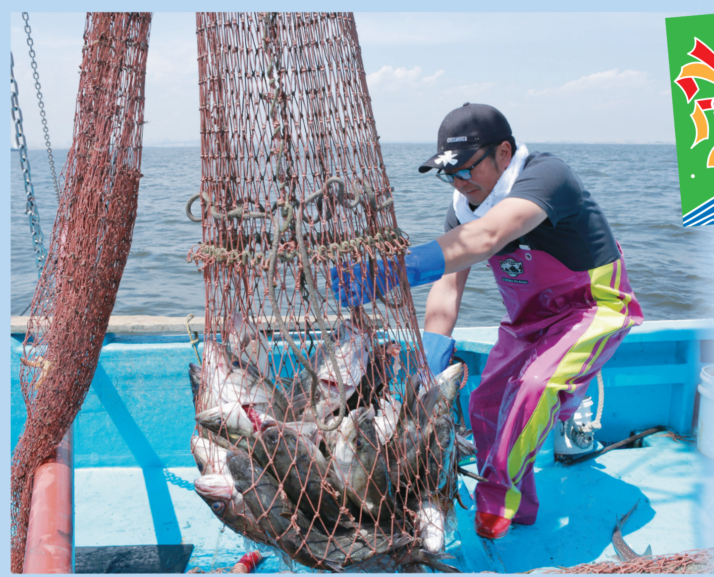
▲スズキの引き上げ作業に力が入ります

まもなく、市川産スズキが旬を迎えます。市川漁港の沖合いには、東京湾内屈指の漁場である三番瀬があり、スズキやカレイのほか、ノリやアサリが獲れ、江戸前として流通しています。市川漁港は、消費地に近接した好立地にある反面、漁港の老朽化などで十分な活動ができず、現在、漁港整備事業が始まっています。今号では、こうした市川の水産業を紹介します。 ☎359-1150 地域整備課