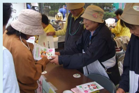
▲活動内容はご自宅でのガーデニングやイベントサポートなど!

サポーターとはガーデニング・シティ いちかわの取り組みに賛同いただける市民・事業者による応援団です。個々が日々行っている活動全てがガーデニング・シティ いちかわを推進しています。なお、サポーターには本紙ガーデニング通信の発送ほか、限定グッズの進呈、交流会(視察研修など)も随時ご案内しております。