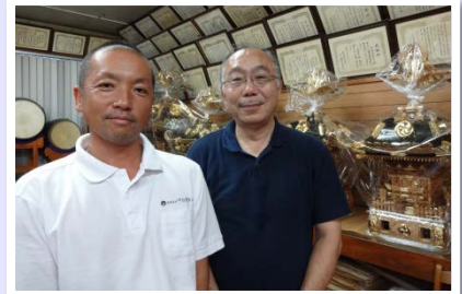
左：中台会長 右：鹿島副会長