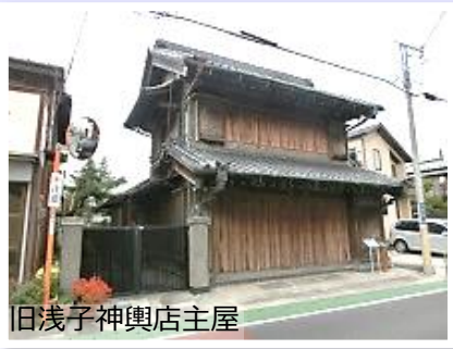
旧浅子神輿店主屋