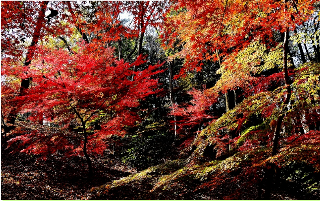
【解説】谷津の地形や湧水を活かした公園。夏にはホタル、春秋のバラ、晩秋のモミジが見所。