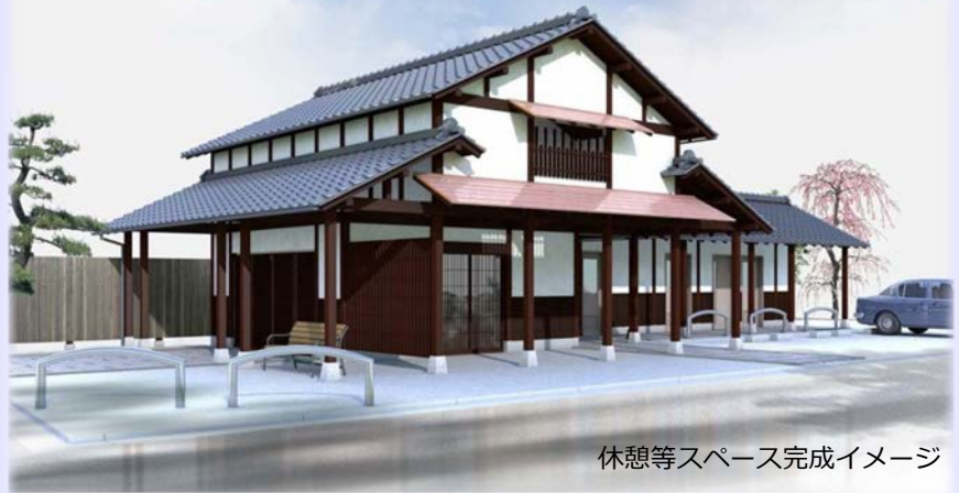
休憩等スペース完成イメージ