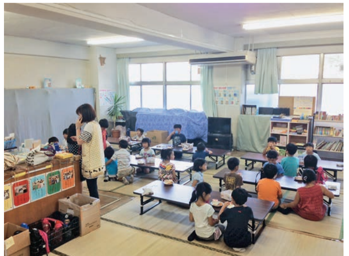
放課後保育クラブ

問 放課後保育クラブの入所申し込みは1月に締め切られるが、締切後新年度までに仕事の異動や転居等で新たな需要が生じうる。特に低学年で待機が生じないよう努めるべきと考えるが、申し込み締め切り後の低学年の優先入所や平均的な欠席者数を考慮した定員外の受け入れ、長期休暇中の臨時的な預かり等、教室の増