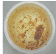
色がついていてもリサイクル可能 異物が残ったものは燃やすごみに

注意2) キャップやラベルが付いたPETボトルは、リサイクルに支障があります。PETボトルから、キャップやラベルをとって、「プラスチック製容器包装類用」の指定袋と一緒にいれましょう。