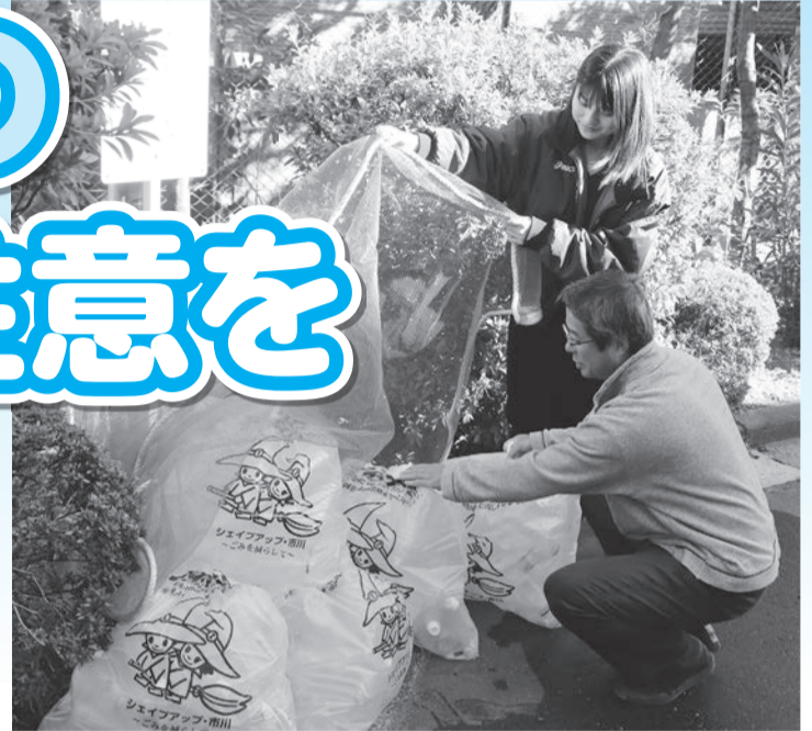
▲分別ルールを守り、午前8時までに出しましょう