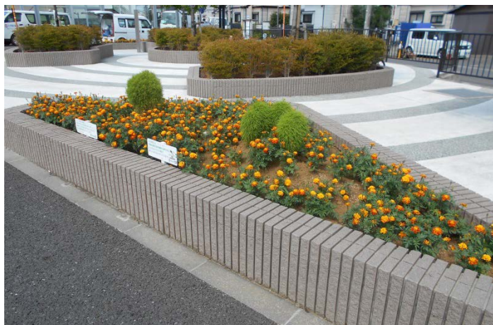
▲育てた花が公共の花壇を彩ります

「マリーゴールド」と「デルフィニウム」の種からの栽培にチャレンジします！ 一緒に始める仲間や充実の講習会もあるので、初めての方も大歓迎です！