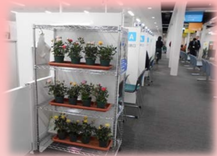
▲仮本庁舎2階市民課の様子

▲配布時に同封しているフラワープレート。プレートの中心に婚姻日の記載ができます。