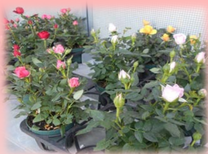
▲ミニバラの納品と管理をしています

これまでに約780組のご夫婦へ渡りました。これを機に若い世代の方にも、ガーデニングに親しんでいただければと思います。