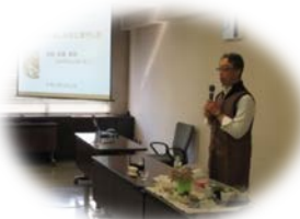
↑ 昨年講習会の様子