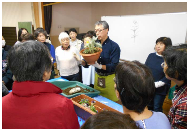
▲「勉強になる！」と好評の講習会