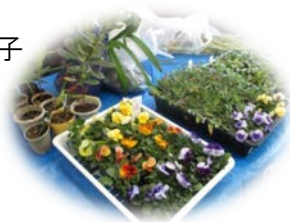
↑ 花苗の持ち寄り交換会!