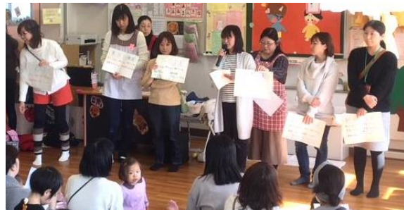
↑ 登園方法や保育時間など基本情報は紙に提示

親しいママからでないといけない情報をたっぷり聞くことができました。熱心にメモを取り、面接の様子や倍率についての質問が出るなど皆さんの関心の高さがうかがわれました。各園、設備や方針が違い、大切にしていること等の特徴があることがわかり、参加者の方からは「それぞれの園の回答を同時にきくことができ対比しやすかった」との感想をいただきました。